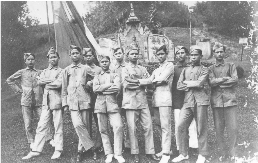
ទាហានស្ម័គ្រចិត្តខ្មែរ ថតនៅវត្តភ្នំ មុនពេលចេញដំណើរទៅប្រទេសបារាំង (ឆ្នាំ១៩១៦)

ក្រុមរក្សាស្រុក មានភារកិច្ចរក្សាសណ្តាប់ធ្នាប់សង្គមនៅគ្រប់ខេត្ត។ ខេត្តនីមួយៗត្រូវជ្រើសរើស«ក្រុមពិជ័យសង្គ្រាម» មួយរវេសនាតូច ដើម្បីធ្វើអន្តរាគមន៍ក្នុងសកម្មភាពយោធាដូចជានៅក្នុងសន្តិការស៊ីយ៉ាមកម្ពុជាខេត្តបាត់ដំបង មុនឆ្នាំ១៩១០ជាដើម ២ ។ ក្រុមរក្សាស្រុកមានចំនួនចន្លោះពី១.៥០០នាក់(១៩១២-១៩១៥) និង ២.២០០-២.៤០០នាក់(១៩១៦-១៩២០)។ ចំណែកក្រុមពិជ័យសង្គ្រាមជាជនជាតិខ្មែរមានចំនួន១.៣៥០នាក់ និង រើស បន្ថែម៥០០នាក់ទៀតពីខែមករា ឆ្នាំ១៩១៦ ទៅ ខែមករា ឆ្នាំ១៩១៧ ដើម្បីចេញទៅច្បាំងនៅទ្វីបអឺរ៉ុប។