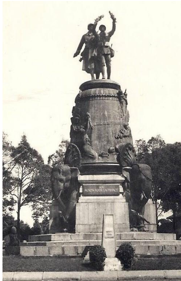
អត្ថបទចងក្រងដោយ៖ លោកស្រី សីន ប័ន្ទអមរា មន្ត្រីលេខាធិការដ្ឋានរបស់ក្រុមប្រឹក្សាបណ្ឌិតសភាចារ្យ នៃរាជបណ្ឌិត្យសភាកម្ពុជា