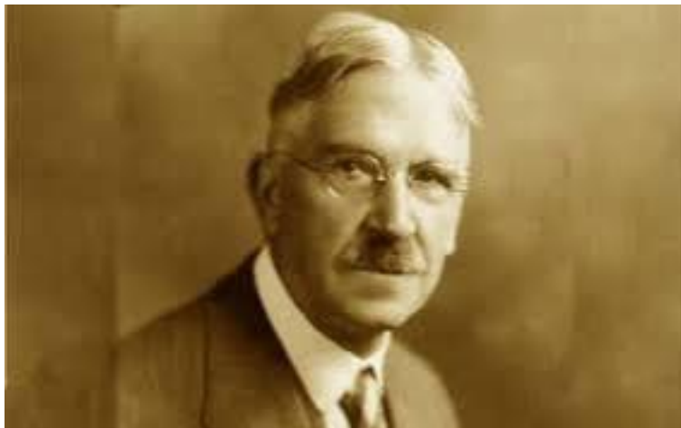
រូបទី២៖ លោកចន ដេវី (John Dewey)

John Dewey បន្ទាប់ពីបង្រៀននៅទីក្រុង Detroit នៅសាកលវិទ្យាល័យ Michigan បានក្លាយជា សាស្ត្រាចារ្យនៅសាកលវិទ្យាល័យ Chicago ក្នុង ឆ្នាំ១៨៩៤ (មើលរូបទី២)។