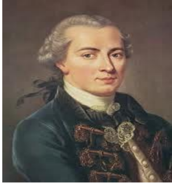
រូបទី១៖ លោក អ៊ីម ម៉ាញូ អែល កង់ថ៍ (Immanuel Kant) ទស្សនវិទូដ៏ល្បីរបស់អាណ្លឺម៉ង់

ការបង្កើតរបស់ Dewey នឹងត្រូវបានទទួលឥទ្ធិពល យ៉ាងខ្លាំងដោយការអនុវត្តជាក់ស្តែងរបស់ អាមេរិក និងការវិវត្តរបស់ Darwin។ ខណៈពេល ដែលសហរដ្ឋអាមេរិកកំពុងត្រួតត្រាដំណាក់ កាលនៃការអភិវឌ្ឍសេដ្ឋកិច្ចយ៉ាងខ្លាំង លោក