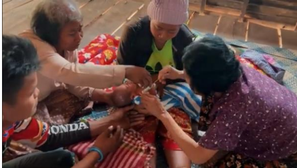
កិច្ចពិធីកាត់សក់បង្កក់ឆ្មប នៅខេត្តសៀមរាប

ខ្មោច។ ពិធីទាំងនេះធ្លុះបញ្ចាំងពីគោលការណ៍ សីលធម៌ក្នុងការរស់នៅរបស់ប្រជាជនខ្មែរ។