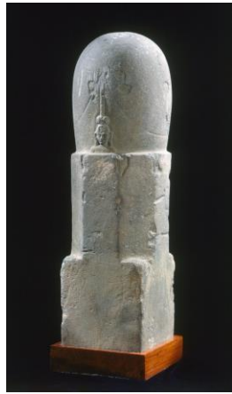
មុខលិង្គ សតវត្សទី ៧-៨

លិង្គ មួយចំនួនទៀតត្រូវបានគេ ចែកជាបីផ្នែក៖ ផ្នែករាងការ៉េជានិមិត្តរូប ព្រហ្ម, ផ្នែកកណ្តាលជានិមិត្តរូបព្រះ វិស្ណុ, និងផ្នែកចុងរាងមូលជានិមិត្តរូប ព្រះសិវៈ ២៧ ។