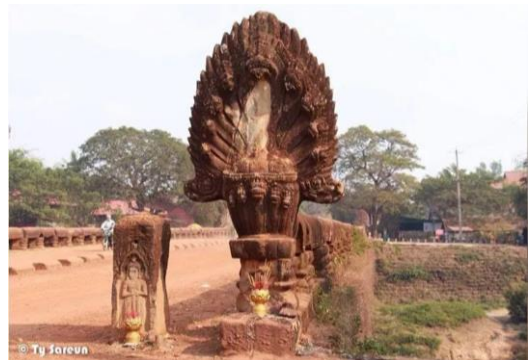
ការដុតចូរបន់ស្រន់បារមីបង្គាន់ដៃនាគ នៃស្ថាន ប្រាប់ទិស ឬស្ថានកំពង់ក្តី ស្រុកជីក្រែង ខេត្តសៀមរាប