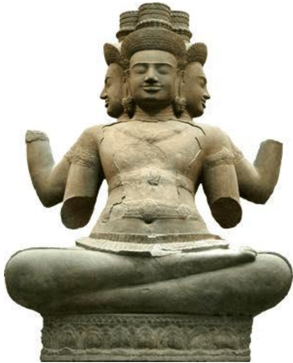
ព្រះព្រហ្ម

សាសនាមានមុខការខាងបង្រៀនប្រៀន ប្រដៅវេទមន្តវិជ្ជា ផ្សេងៗ; ក្សត្រិយៈ ឬ ខត្តិយៈ (Kshatriya) កើតពី ព្រះពាហុ ព្រហ្ម មានមុខការគ្រប់គ្រងនិងរក្សា ប្រទេស; វៃស្សៈ ឬ វៃស្សៈ (Vaishya) កើត