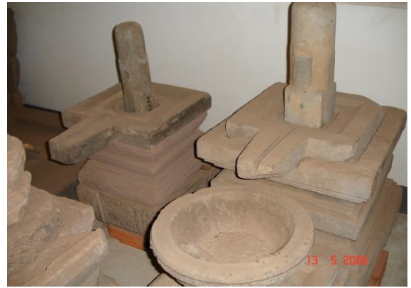
សម្ព័ន្ធនៃយោនីនិងសិវលិង្គ ជានិមិត្តរូបបង្កើតលោក