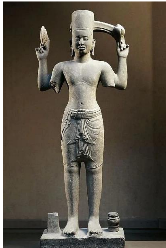
បដិមាព្រះវិស្ណុដៃ៤ មកពីរូបអារក្សលើ ភ្នំ គូលែន, ថ្មភក់ សតវត្សទី៨, សារៈមន្ទីរភ្នំមេត (Guimet) ក្រុងប៉ារីស ប្រទេសបារាំង

ក្រៅពីអវតារទាំង១០ ព្រះវិស្ណុនៅ មានលក្ខណៈសម្គាល់ពិសេសផ្សេង ទៀត ដូចជា មានព្រះ កេស ១ មានម្ជុករាង ស៊ីឡាំង; មានដៃ២, ៤, ឬ៨ ដែល ឆ្វេងខាង មុខកាន់ផ្កាឈូក (ធាតុខ្យល់), ដៃស្តាំខាង មុខកាន់មោងស័ក្ត (ធាតុដី), ដៃឆ្វេងខាង