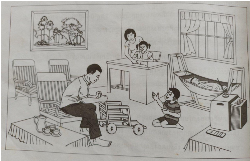
រូបទី២៖សកម្មភាពឪពុកម្តាយបង្ហាត់បង្រៀន អប់រំនិងថែទាំកូនៗ (រូបរបស់ក្រសួងអប់រំក្នុងសៀវភៅសិក្សាសង្គម)

គ្រួសារតូច ជាគ្រួសារដែលមានសមាជិក យ៉ាងច្រើនប្រាំនាក់រស់នៅជាមួយគ្នា មានដូច ជា ឪពុកម្តាយ កូនប្រុស ស្រី និងអ្នកធ្វើការផ្ទះ ម្នាក់(រូបទី២)។