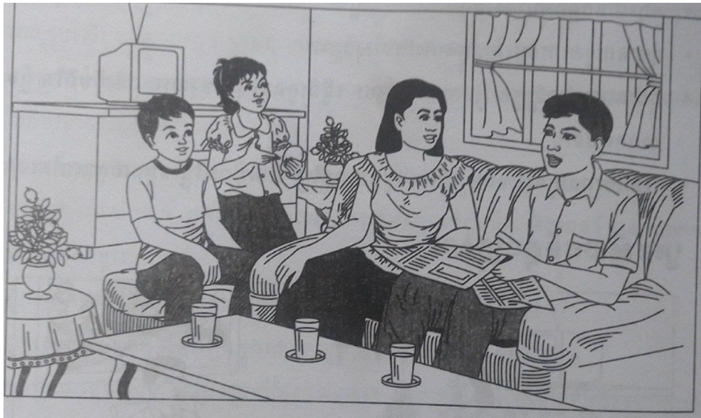
រូបទី៤៖ រូបគ្រួសារតូចរស់នៅប្រកបដោយសុភមង្គល (រូបរបស់ក្រសួងអប់រំក្នុងសៀវភៅសិក្សាសង្គម ថ្នាក់ទី៨)