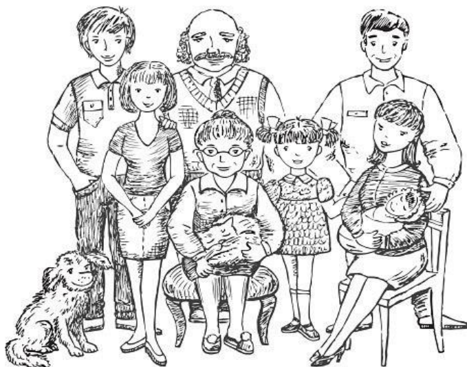
រូបទី៣៖ រូបគ្រួសារធំដែលមានសមាជិកលើសពី៦នាក់